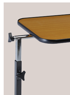
Ajustement latéral (421014)