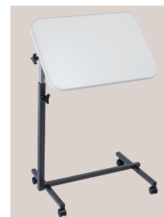
Inclinaison plateau EASY gris perle (421000)